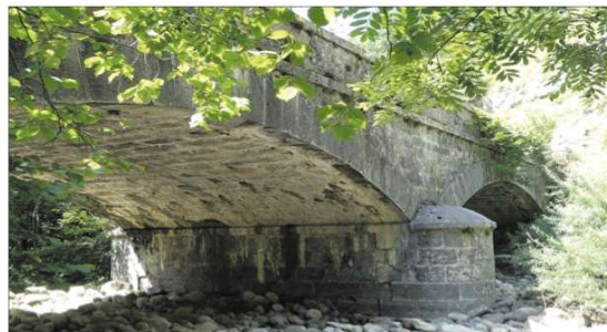
Arriba y a la derecha, imágenes de los puentes de La Hoz y Las Vegas, ambos de piedra y contruidos a principios del siglo pasado. En las fotografías de abajo, mojón kilométrico en la carretera de Liérganes a San Roque y letreiro alicatado con azulejos con el nombre del pueblo pasiego.