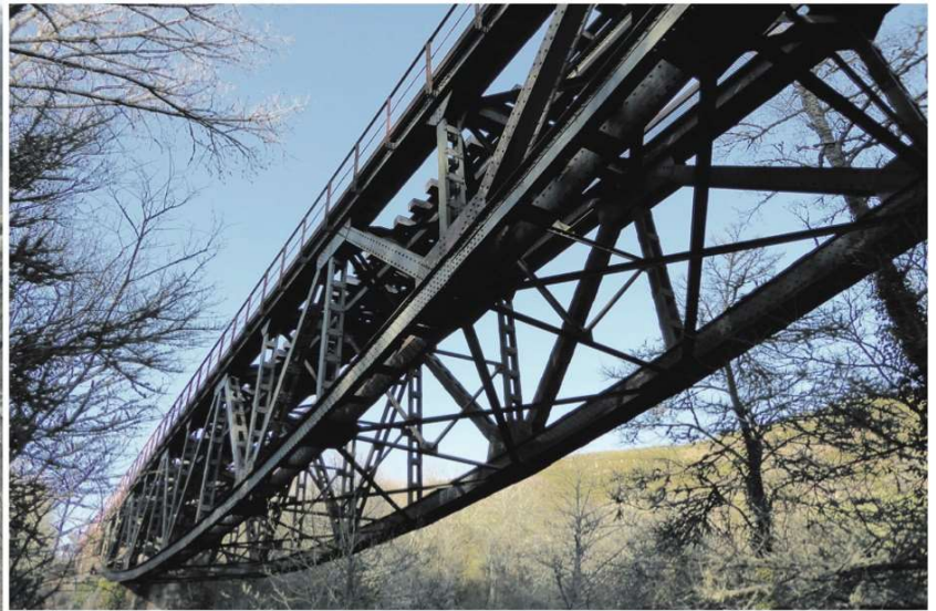
A la izquierda, puente del ferrocarril de La Robla sobre el embalse del Ebro cerca de Renedo en Las Rozas de Valdearroyo. Arriba, detalle de la estructura en las proximidades de de Arroyo, en el mismo término municipal, y, a la derecha, paso sobre el embalse del Ebro cerca de la localidad de Arja, ya en la provincia de Burgos. Las tres imágenes pueden contemplarse desde las carreteras que discurren próximas a la vía ferroviaria cuya construcción data de finales del siglo XIX.