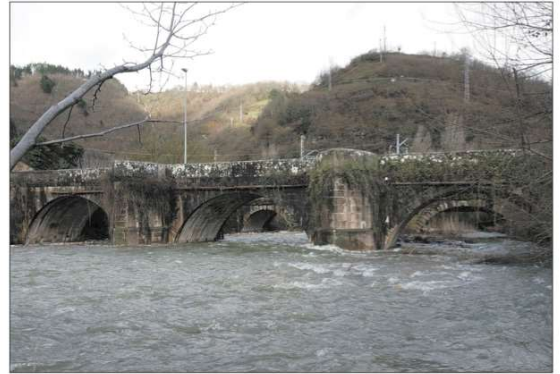
A la izquierda, puente del camino real en Santa Olalla (estrecho de Portolín) sobre el río Besaya. Arriba, puente sobre el río Los Llares, en Las Fraguas. A la derecha, leguario en Las Fraguas, y, debajo de estas líneas, guardarruedas al sur de Mollado, que representan algunos de los hitos pétreos que tiene el camino real a su paso por el Valle de Iguña.