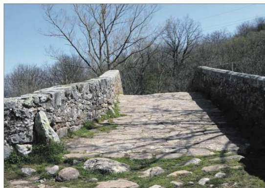
A la izquierda, puente de Riaño sobre el río Híjar en Campoo de Suso. Arriba vista de sus petriles y enchachado del pavimento. A la derecha, puente en la carretera a Mazandero y, abajo, puente sobre el río Híjar en Espinilla, en la carretera CA-280 que se dirige hacia el Collado de Somahoz.