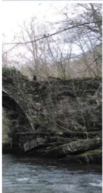
Arriba, puente sobre el Miera en la localidad de Mirones. En la fotografía de la izquierda, la notable bóveda pétrea de medio punto que cruza el río en Linto, y, a la derecha, puente antiguo en La Hoz. Junto a esta obra se ubica un molino harinero edificado en el siglo XVIII/ LVC

El Alto Miera recoge aguas de las zonas altas de la cornisa Cantábrica, a partir de la cara norte del Castro Valnera, y de las vaguadas laterales de morfología glaciar. Algo más abajo, y sobre todo en el valle medio, que coincide en buena parte con el municipio de Miera, se encuentra encajonado entre los macizos cársticos y las estribaciones del Porracolina, al este, y Las Enguizas, por el oeste, ambos pertenecientes a un conjunto de rocas sedimentarias procedentes del Cretácico.