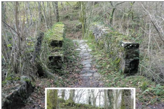
Vista del pavimento encachado y pretiles del puente de Linto, y tramo empedrado del camino entre Linto y La Cárcoba.