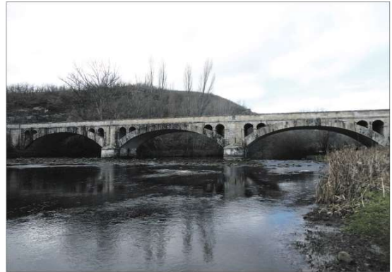
A la izquierda y arriba, imágenes del puente de Báscones de Ebro (Berzosilla-Palencia) sobre el río Ebro, obra de hormigón y de cantería de los años 40 del siglo XX. A la derecha, detalle del puente de Quintanilla de An que muestra el apoyo de sus dos vigas en la pila central, y, debajo de estas líneas, vista general de la infraestructura construida con hormigón armado. / LVC